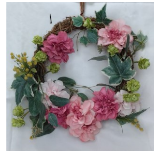
花飾り 故 佐々木正子

言葉足らずの愛を 愛を貴方へ 私は決して今を 今を憎んではない 歪んだ雲が空を 空を濁して 私の夢は全て 全て置いてきたの 命ある日々 静かに誰かを 愛した日々 空が晴れたら 愛を 愛を伝えて 涙は明日の為 新しい花の種