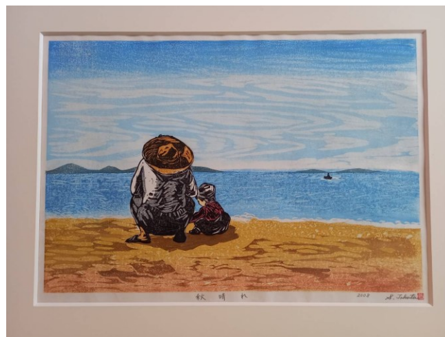
版画 「秋晴れ」 高田澄子

いま素直な 気持ちになれるなら 憧れや 愛しさが 大空に はじけてひかるだろう アイ ビリーブ イン フューチャー 信じてる